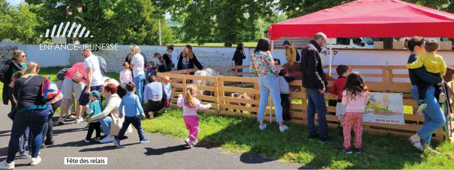
Fête des relais